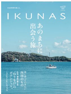
あなまちに 出会う旅 2026 vol.22 1650円